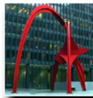
b. der Flamingo