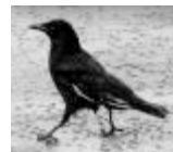
d. eine Krähe